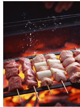
惣菜 焼き鳥(豚、ねぎま、鶏) 写真No. SZ144-127