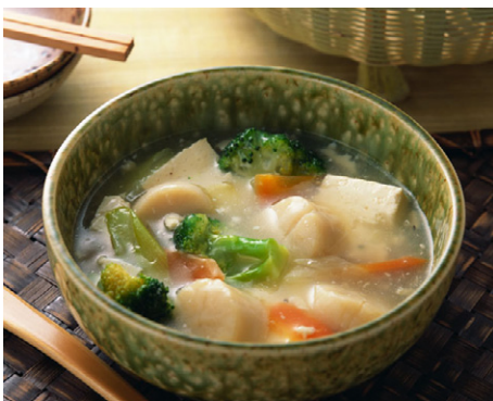
惣菜 ほたて貝と豆腐のうま 写真No. MX175-055