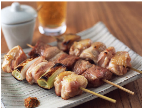
惣菜 焼き鳥 写真No. SZ144-134