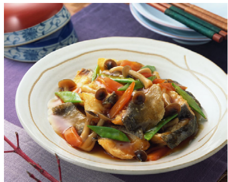
惣菜 たら唐揚野菜あんかけ 写真No. MX175-049