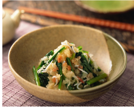
惣菜 小松菜の梅おろし和え 写真No. MX175-066