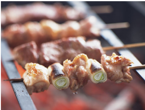
惣菜 焼き鳥 写真No. SZ144-129