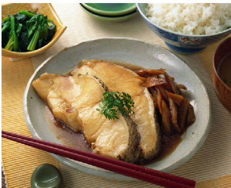
惣菜 むつの煮付け 写真No. MX175-039