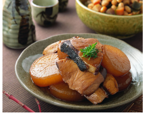
惣菜 ぶり大根 写真No. MX175-032