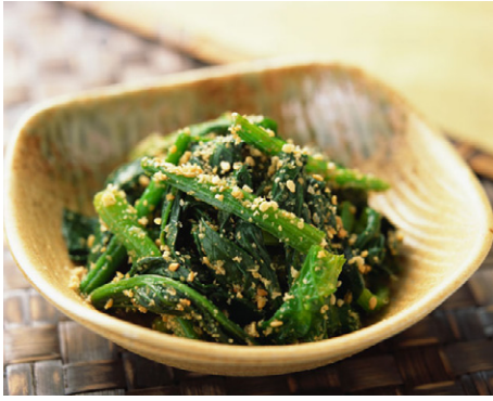
惣菜 ほうれん草の胡麻和え 写真No. MX175-063