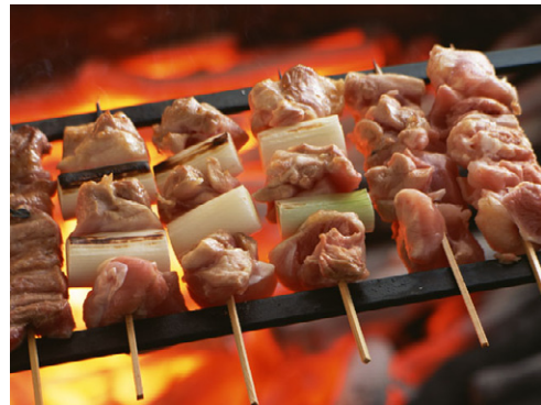
惣菜 焼き鳥(豚、ねぎま、鶏) 写真No. SZ144-131