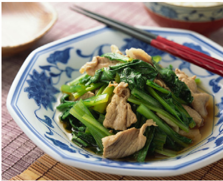
惣菜 小松菜と豚肉の煮物 写真No. MX175-067