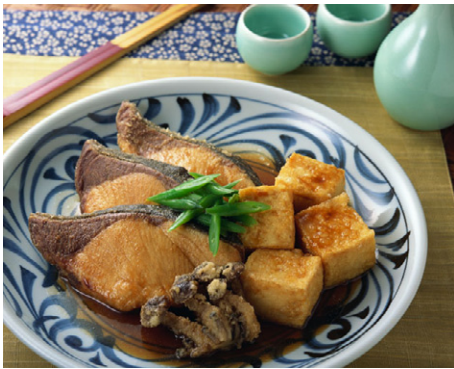
惣菜 ぶりと豆腐の揚げ煮 写真No. MX175-034