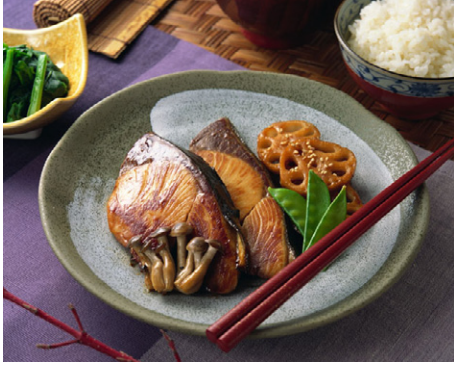
惣菜 ぶりの照焼き 写真No. MX175-031