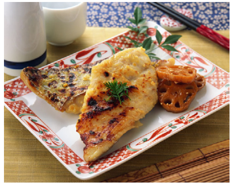
惣菜 さわら西京漬 写真No. MX175-036